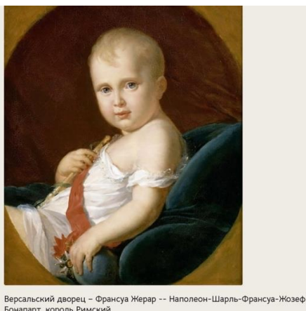
Версальский дворец – Франсуа Жерар -- Наполеон-Шарль-Франсуа-Жозеф Бонапарт, король Римский

3.1. В одном из эпизодов «Войны и мира» Л. Толстой раскрывает смысл этого термина, описывая картину 1812 года: «Весьма красивый курчавый мальчик, со взглядом, похожим на взгляд Христа в Сикстинской мадонне, изображён был играющим в бильбоке. Шар представлял земной шар, а палочка в другой руке изображала скипетр».